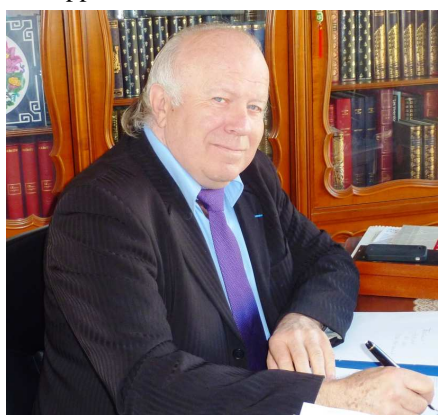
Gérard TISSERONT Communication

Nous sommes en liaison avec nos services de coopération et d'action culturelle de nos ambassades (SCAC) qui nous apportent leur appui.